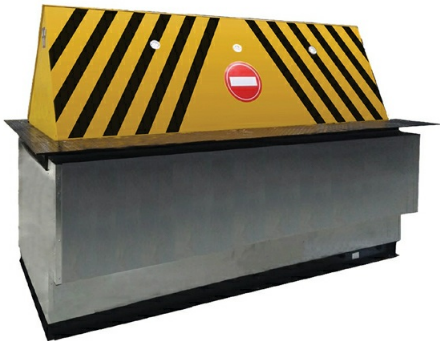
Фото Блокиратор дорожный RB 900 серии RB RB-20F90 CAME RB-20F90

Отправьте запрос на коммерческое предложение и получите индивидуальные цены и сроки поставки