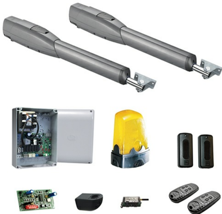
Фото Комплект автоматики для двухстворчатых распашных ворот ATS30DGS GSM Connect CAME ATS3DGS_GSM_KIT

Отправьте запрос на коммерческое предложение и получите индивидуальные цены и сроки поставки