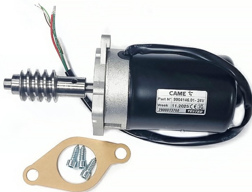
Фото Электродвигатель VXV06V V.1 в сборе CAME 88001-0287

Отправьте запрос на коммерческое предложение и получите индивидуальные цены и сроки поставки