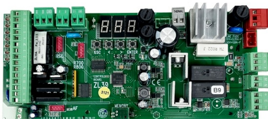
Фото Плата блока управления ZL39A CAME 88001-0192

Тел: +7 499 681-75-28 | Email: sale@came-russia.ru | https://came-russia.ru