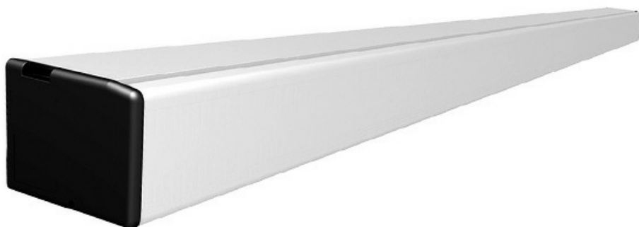
Фото Автоматика для двустворчатой раздвижной двери FLUO-SLL LIGHT Автоматика для двустворчатой раздвижной двери, ширина прохода до 948 мм CAME 818SL-0120

Отправьте запрос на коммерческое предложение и получите индивидуальные цены и сроки поставки