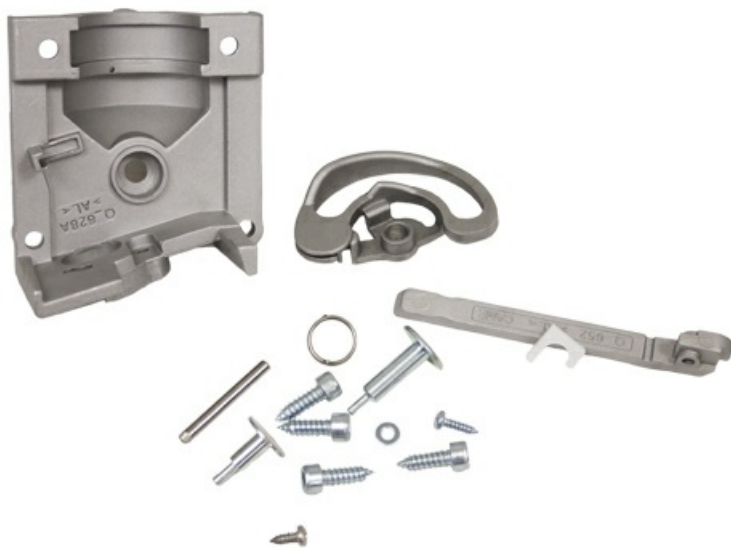
Фото Кожух редуктора с механизмом разблокировки OPP001 CAME 119RID429

Отправьте запрос на коммерческое предложение и получите индивидуальные цены и сроки поставки